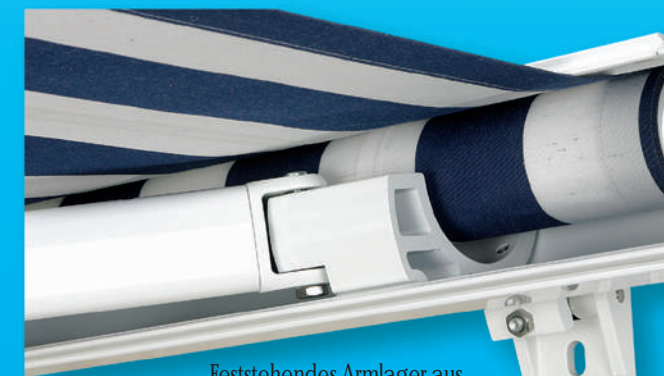
Feststehendes Armlager aus Aluminium-Strangpressprofil

Durch eine problemlose Einstellung am Montagebock kann die Ausfall-schräge der VARISOL K200 den-Gegebenheiten am Montageort leicht angepasst werden. Der maximal mögliche Neigungswinkel beträgt 40 Grad.